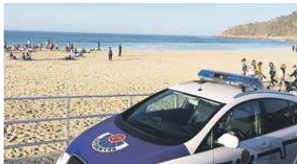
La Ertzaintza acordonó la zona para intentar sacar la lancha.

que se ha celebrado el fin de semana congregaron a numerosas personas, que presenciaron esos momentos de angustia. «Llegué corriendo y para entonces ya había varios surfistas que estaban intentando rescatar a la gente». Por la megafonía del campeonato se pidió la intervención de los surfistas. En el resto del agua también se encontraban numerosos aficionados a este deporte. Por suerte, no faltaron voluntarios.