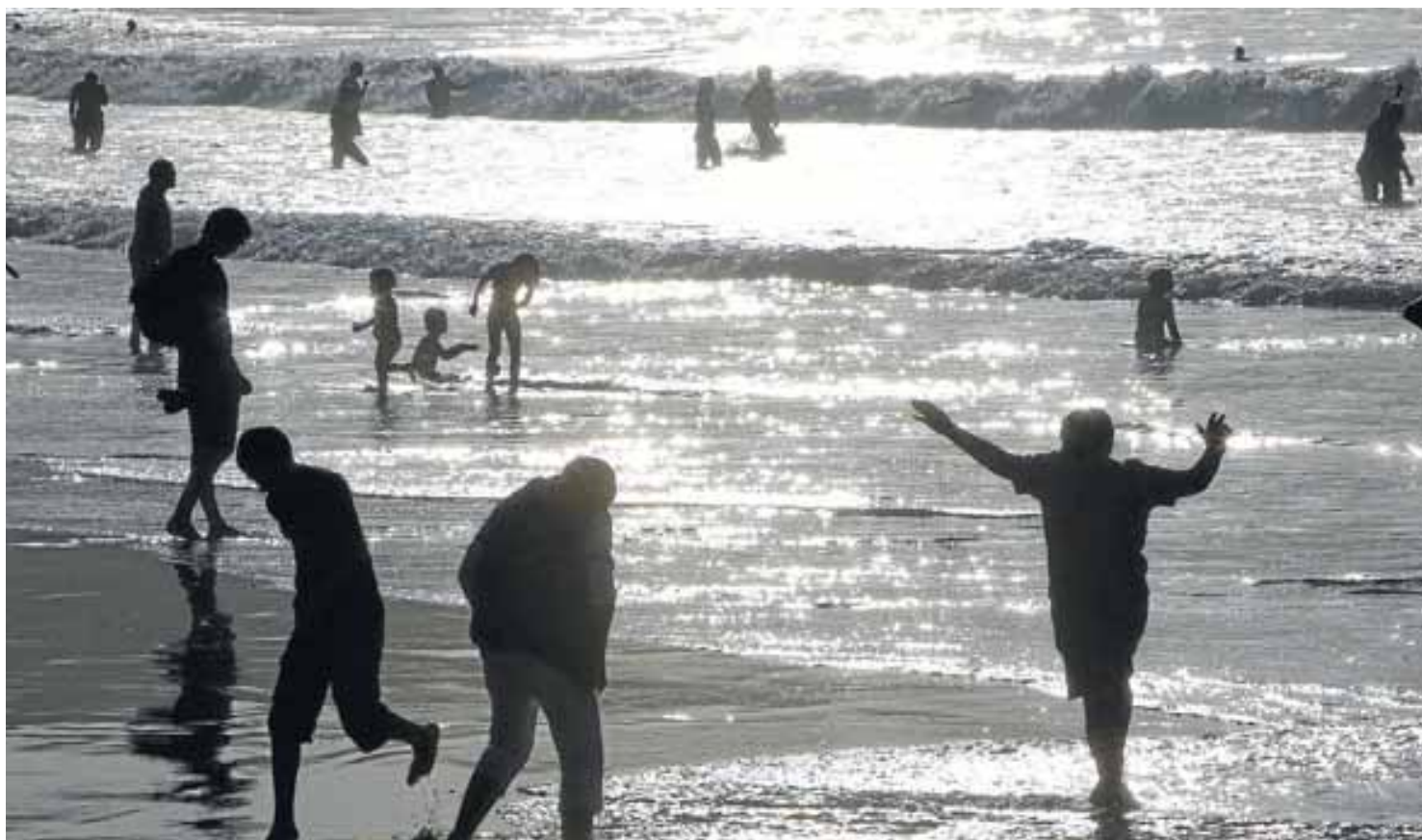
Un grupo de personas se baña el pasado lunes en la playa de La Concha de Donostia, aprovechando las altas temperaturas.