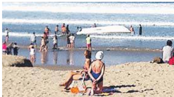
Momento en que volcó la lancha ayer a mediodía.

La lancha, de unos cuatro metros, había volcado a la altura de la discoteca People, más o menos en mitad de la playa. A esa hora, el arenal estaba abarrotado de público. El sol y el campeonato de Euskadi de surf