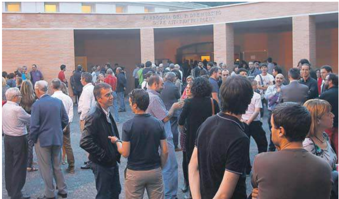
Decenas de personas acudieron a la parroquia de Mendillorri para despedir a los dos hermanos fallecidos.

Cada año miles de surfistas eligen como destino la playa de Zarautz, por lo que ante este auge de esta actividad, el Ayuntamiento ha elaborado una guía, con consejos prácticos. La guía, editada en cuatro idiomas –euskera, castellano, inglés y francés– se repartirá en los centros escolares, en las oficinas de turismo así como en las escuelas de surf. Detalla las características que reúne la playa de Zarautz, con varios consejos básicos para la práctica de este deporte.