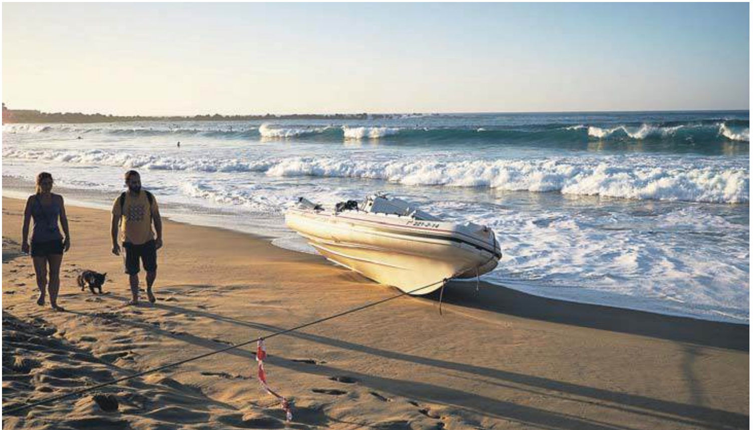
La embarcación quedó en la orilla, a la espera de ser rescatada cuando subiera la marea. En el momento del suceso, viajaban seis personas, tres adultos y tres niños.