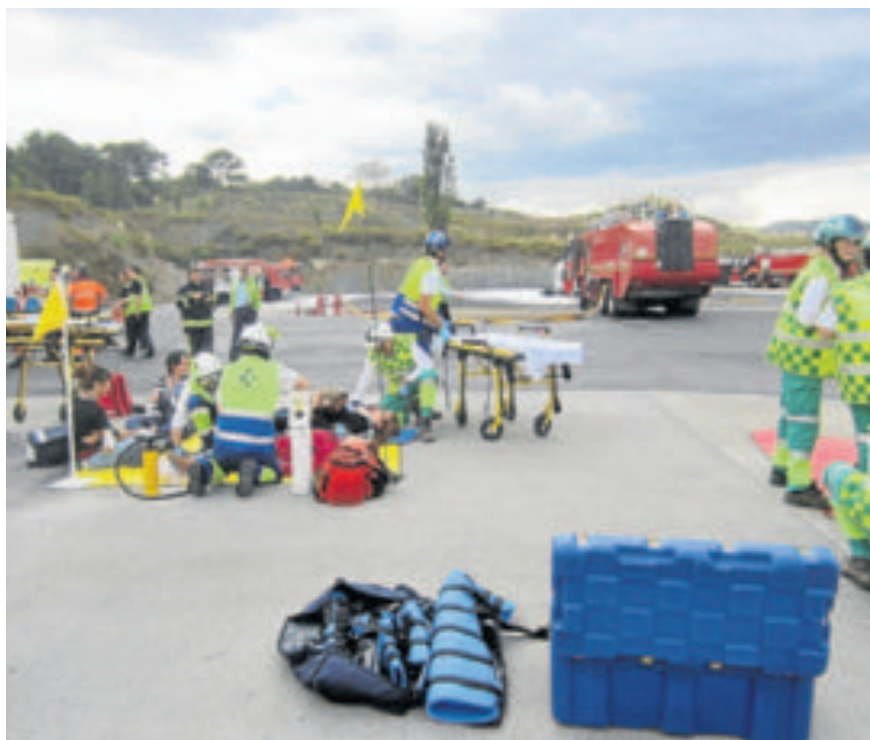
Los equipos de emergencia atienden a los figurantes.